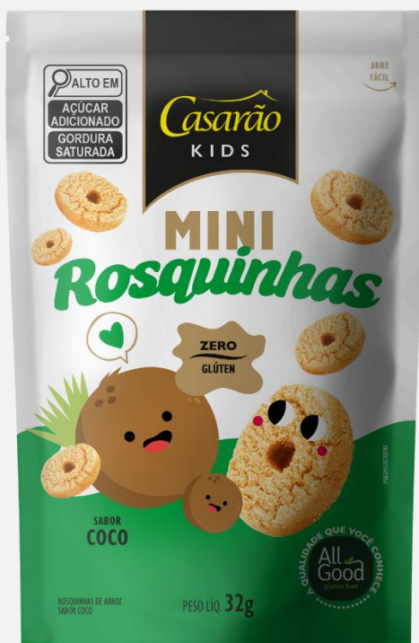
Mini Rosquinhas de Arroz - Sabor Coco 32g