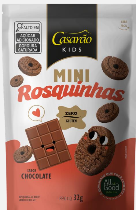
Mini Rosquinhas de Arroz - Sabor Chocolate 32g