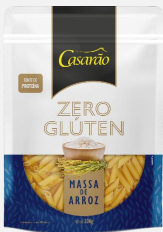
Massa Alimentícia de Arroz - Penne 200g