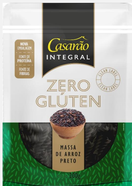
Massa Alimentícia de Arroz Preto – Fusilli 200g / Integral