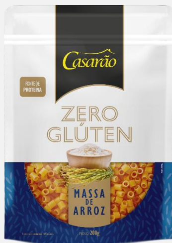
Massa Alimentícia de Arroz - Ave Maria 200g