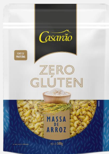
Massa Alimentícia de Arroz - Amori 200g